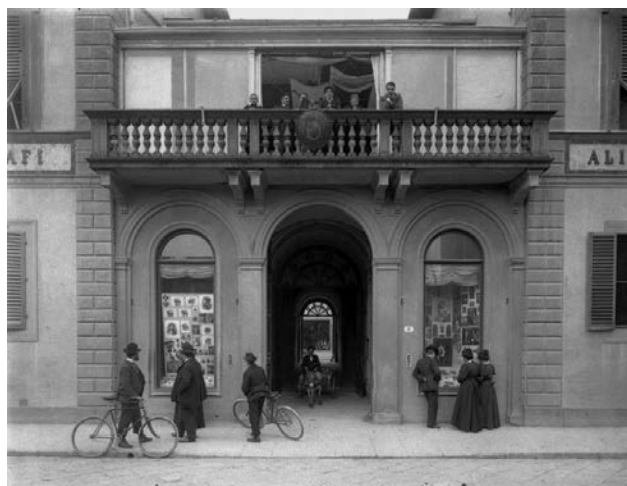
Ingresso dello Stabilimento Alinari, 1900

La Fratelli Alinari è l'unico stabilimento fotografico al mondo ad aver mantenuto ininterrottamente la propria attività produttiva dal 1852 ad oggi .