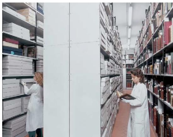
Sala di conservazione delle Raccolte Museali Fratelli Alinari

- le sale di conservazione delle Raccolte Museali Fratelli Alinari anch'esse ubicate nello stesso edificio, nelle quali si conserva un ricchissimo patrimonio di materiali fotografici originali (dai dagherrotipi ai negativi su carta, dalle stampe su carta salata a quelle all'albumina e a tutte le numerose tecniche di stampa caratteristiche delle varie epoche della fotografia) che costituiscono una collezione unica sulla storia della fotografia internazionale, attraverso i capolavori dei più importanti maestri dell'800 e del 900.