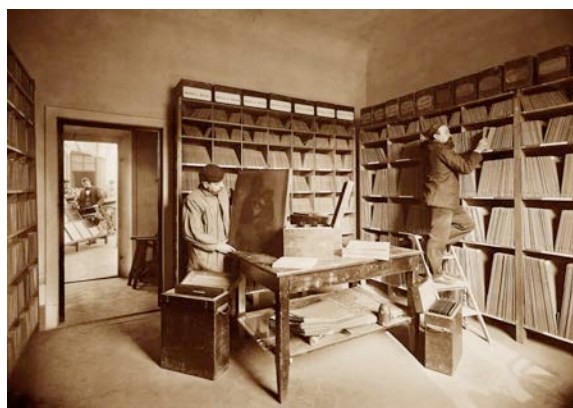
L'archivio dei negativi su lastra di vetro, 1900

- in primo luogo, l'insieme degli Archivi Storici , costituiti dalle 120.000 lastre negative originali su vetro prodotte dallo Stabilimento a partire dagli inizi della propria attività ed ancora conservate negli ambienti predisposti all'epoca per l'archiviazione, alle quali si aggiungono le 130.000 degli archivi Brogi; Anderson, Chauffourier, Fiorentini e Mannelli unitisi agli Archivi Alinari negli anni '50-'60.