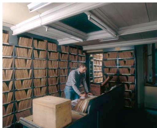
L'archivio dei negativi su lastra di vetro, oggi

LARGO F.LLI ALINARI, 15 - 50123 FIRENZE (ITALY) - Tel. +39 055 23951 - Fax +39 055 2382857