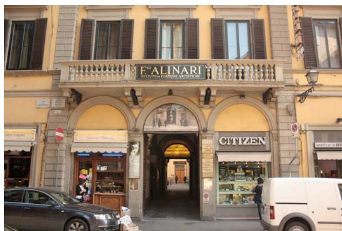
Ingresso dello Stabilimento Alinari, oggi

La sede di Largo Alinari 15, che ospita lo stabilimento dal 1863 è visitabile su appuntamento e accompagnati da una guida, in italiano o inglese