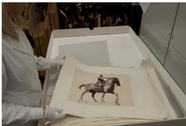
Fotografie originali delle Raccolte Museali