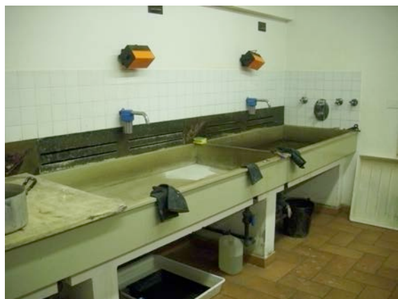
Le vasche per lo sviluppo ed il lavaggio delle stampe fotografiche nella camera oscura

- le attrezzature , gli ambienti e i procedimenti con i quali ancora oggi si eseguono stampe fotografiche utilizzando le lastre negative originali in vetro